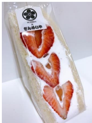
フルーツサンド(いちご) 540 円

八百屋ならではの目利きで選んだ旬な果物がぎっしり。メディアで数多く取り上げられた大人気の「ぜんめいや」のフルーツサンド。各店舗や期間限定の POP-UP SHOP でしか手に入らない極上のスイーツをこの機会にぜひ。