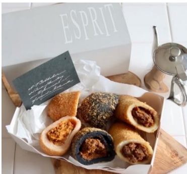
3 種のカレーパンセット 1,300 円

独自配合した小麦粉や厳選された材料を使用し、素材本来の味を生かしながら、おいしさを最大限に引き出した ESPRIT(エスプリ)こだわりのパン。ふっくら焼き上げた出来立てのパンを最新の冷凍方式でおいしさそのままにぎゅっと閉じ込めました。