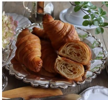
クロワッサン 350 円