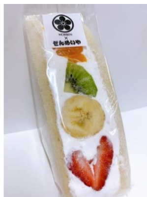
フルーツサンド(ミックス) 540 円