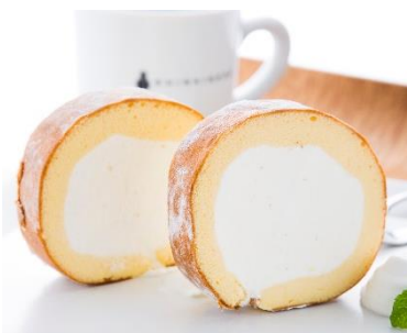
スーパースターロール 831円